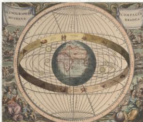
Das Tychonische Weltbild in einer Darstellung von 1661

Der dänische Astronom Tycho Brahe entwarf einen Kompromiss zwischen geo- und heliozentrischem Weltsystem: Die Erde ruhte weiterhin im Zentrum der Welt, Mond und Sonne bewegten sich um die Erde. Die weiteren Planeten umkreisten aber die Sonne, nicht mehr die Erde. Zahlreiche Astronomen befürworteten in der ersten Hälfte des 17. Jahrhunderts dieses Modell, da damit alle bekannten astronomischen Beobachtungen erklärbar waren. Zudem erschien es besser mit der Bibel vereinbar als das copernicanische System. Galilei konnte durch seine Beobachtungen das ptolemäische Weltbild ausschließen, doch fand er gegen das von Brahe keine Argumente.