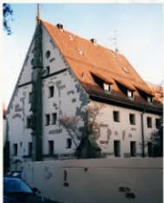
Heilsbronner Fürstenschule: Hier lernte Marius zwischen 1586 und 1601

Als Hofmathematiker hatte er jährlich Kalender zu erstellen, denen eine "Prognostica" (Wetter- und sonstige Vorhersagen) angehängt war. Darüber gehörte auch die Beobachtung der Himmelsbegebenheiten zu seinen Aufgaben. Ab 1609 konnte er dazu ein kleines Teleskop („Perspicillum“) benutzen, mit dem er auch die Jupitermonde fand. Über den Anspruch an der Erstentdeckung entbrannte bald ein heftiger Prioritätenstreit. Erst im 20. Jahrhundert wurde geklärt, dass Marius seine Entdeckungen unabhängig von anderen machte und seine Beobachtungen in vielen Punkten sogar genauer und umfangreicher als die Galileis waren. Unstrittig war schon zu Marius Lebzeiten, dass er 1612 als Erster den Andromedanebel mit dem Fernrohr beobachtete.